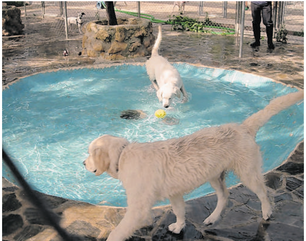
Algunas residencias tienen piscinas donde los animales pueden jugar y aliviar las altas temperaturas ABC

A pesar de que puede ser una separación traumática la del animal y su dueño, desde las residencias no aconsejan que se lleven a las mascotas ningún juguete propio ni ninguna prenda que le pueda resultar familiar de su amo. Y es que la experiencia dice que, al final, el animal se adapta con mucha facilidad. «Son animales que muchas veces viven en pisos, siempre salen con correa y aquí pasean y juegan en la piscina. Son también como sus vacaciones», comenta Rodríguez.