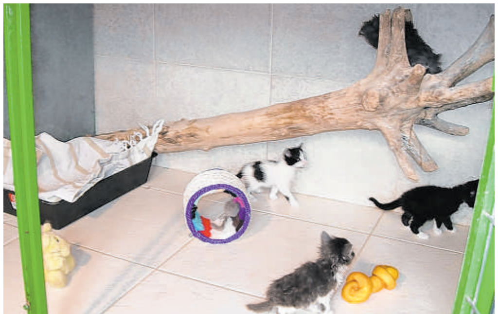
Tras los perros, son los gatos los inquilinos que más copan estas residencias de animales ABC